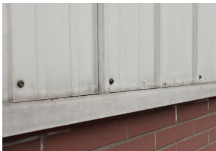
↑ 2011年拍摄 ↓ 2011年拍摄

五粮液酒厂2005年开始扩建，屋面和墙面分别采用宝钢不同颜色的氟碳彩涂钢板，屋面颜色宝钢蓝，墙面颜色骨白色，热镀锌基板。