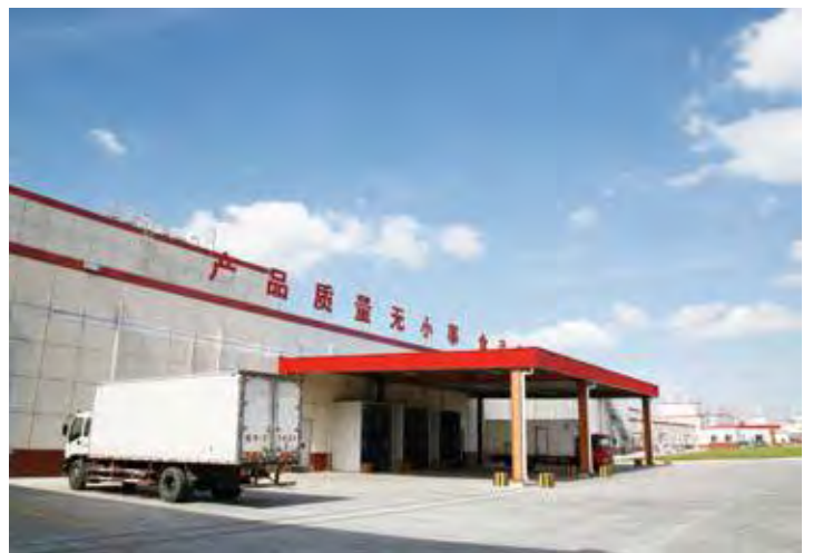
↑ 2016年拍摄 ↓ 2016年拍摄