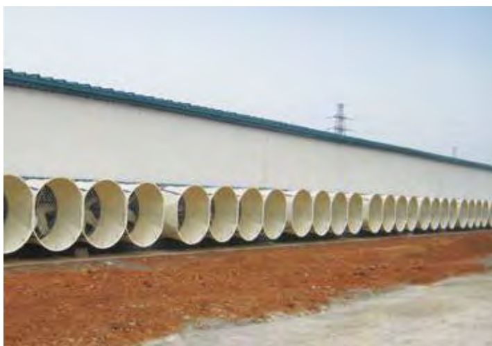
↑ 2016年拍摄 ↓ 2016年拍摄