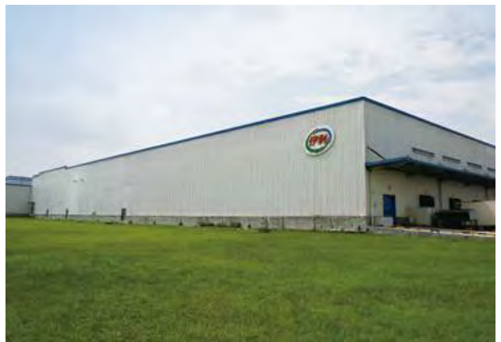
↑ 2016年拍摄 ↓ 2016年拍摄

成都伊利乳业位于四川省成都市邛崃市，是内蒙古伊利实业集团股份有限公司在西部地区设立的乳制品重要生产基地。厂房于2008年初投产，初期投资达到2.44亿元，年销售收入10亿元以上，是成都乃至西南地区重要的奶制品供应商。