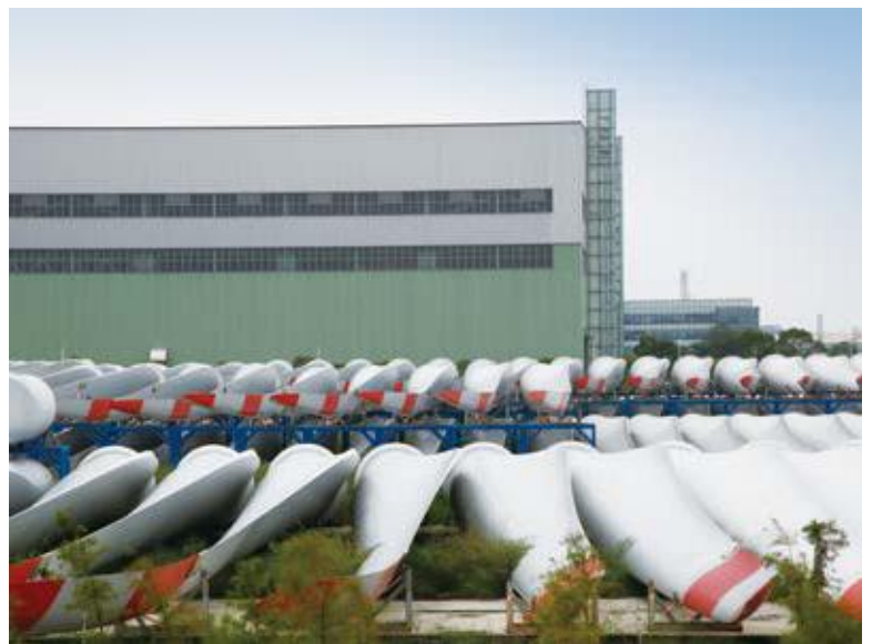
← 2016年拍摄 ↑ 2016年拍摄