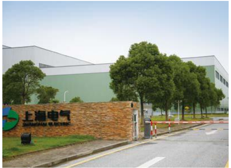
↖ 2016年拍摄 ↑ 2016年拍摄