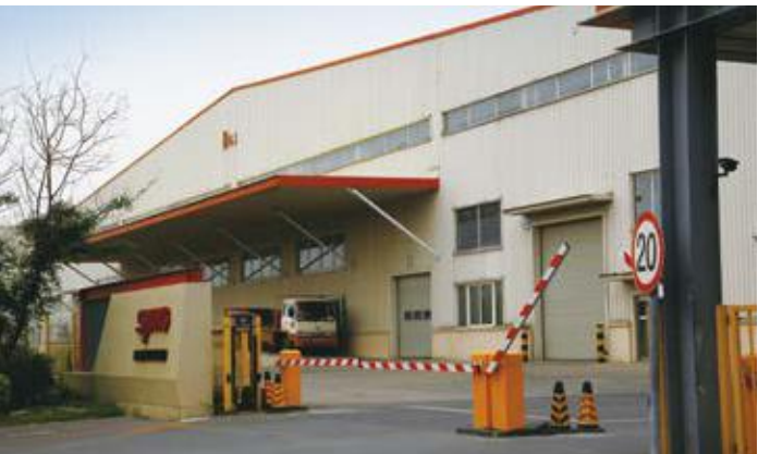
↙ 2016年拍摄 ↓ 2011年拍摄

沈阳数控机床产业园，位于沈阳经济技术开发区，2006年建成。沈阳机床集团数控机床产业园是辽宁省面向“十一五”的重点项目，是振兴东北老工业基地的标志性工程，建筑面积48万平方米。通过搬迁改造，促进结构调整，作为世界同行10强企业的沈阳机床将实现由数控和普通机床并举向以数控机床为主的格局转变，支撑企业在2010年进入世界机床行业前3强。采用宝钢镀锌铝锌普通聚酯彩涂板，牌号为TDC51D+AZ，颜色为柠檬黄、象牙白和纯橙。