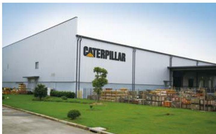
↑ 2016年拍摄 ↓ 2016年拍摄