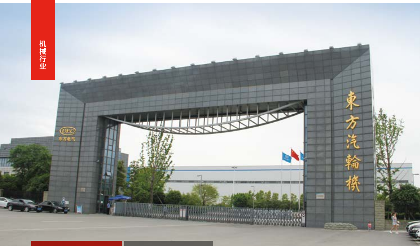
↑ 2016年拍摄 ↓ 2011年拍摄