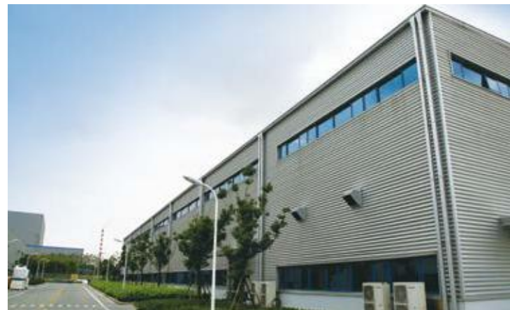
↑ 2016年拍摄 ↓ 2016年拍摄

锦湖日丽于2000年由锦湖石化与上海日之升共同投资组建，是中国第一家在PC/ABS、ABS领域拥有原料和相容剂聚合技术的塑料改性企业。锦湖日丽凭借先进技术和科学管理，目前已通过ISO9001:2008和ISO/TS16949:2009质量体系认证和ISO14001:2004环境管理体系认证，被授予“上海市高新技术企业”、“上海市科技小巨人企业”、“上海市创新型企业”、“中国合成树脂供销协会副理事长单位”等荣誉称号。厂房选择TDC51D+AZ镀铝锌彩涂板，涂料种类为SMP，颜色为银色，涂层重量150克/平方米。厂房建于2015年。