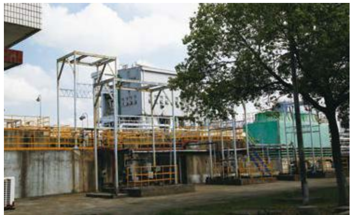
↑ 2016年拍摄 ↓ 2016年拍摄

前身为科宁化工(中国)有限公司, 2010年被国际著名化工企业巴斯夫全资收购。公司总资产10.89亿元, 主要生产表面活性剂、美容卫生用品、油田化学品、洗涤用品等。厂房选用宝钢TS350GD+AZ高强度镀铝锌彩涂板, 涂料种类为PVDF, 颜色为海蓝、冰蓝、宝钢蓝。厂房建于2013年。