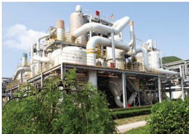
↑ 2016年拍摄 ↓ 2016年拍摄

万华化学集团股份有限公司主要从事异氰酸酯、多元醇等聚氨酯全系列产品、丙烯酸及酯等石化产品、水性涂料等功能性材料、特种化学品的研发、生产和销售，是全球最具竞争力的MDI制造商之一，欧洲最大的TDI供应商。2013年7月开始采购宝钢彩涂用于管道和设备的防护包装。使用牌号TDC51D+Z、TDC52D+Z，氟碳PVDF涂层2/2，锌层重量220克/平方米，颜色为交通白。正面涂层大于25微米，背面涂层大于14微米。经实地回访检测，使用2年后漆膜厚度25.4微米，粉化1级，整体颜色无变化。