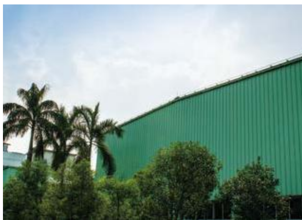
↑ 2016年拍摄 ↓ 2016年拍摄