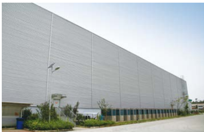
↑ 2016年拍摄 ↓ 2016年拍摄