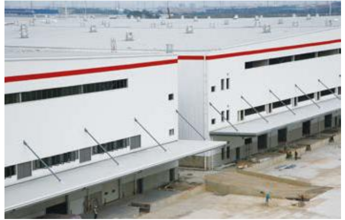
↑ 2016年拍摄 ↓ 2016年拍摄

昆山京东物流有限公司作为国内最大的自营式电商企业，京东商城的市场占有率节节攀升，不仅为消费者提供购物平台，同样提供了便捷快速的物流服务。昆山京东物流位于干灯镇，是京东全国性物流中心之一，拥有庞大的仓储设施，让消费者感受到卓越的配送速度和服务。