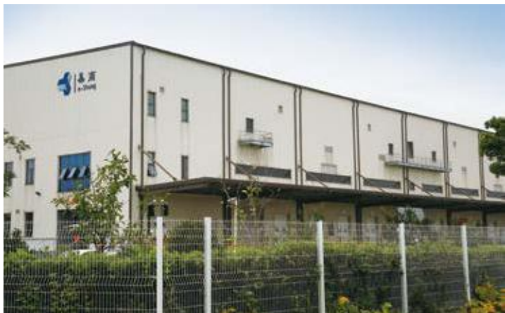
↑ 2016年拍摄 ↓ 2016年拍摄