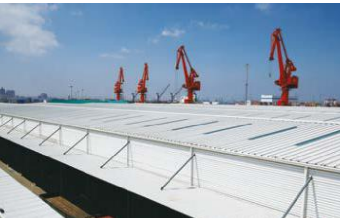
↙ 2016年拍摄 ↓ 2016年拍摄

青岛港位于山东半岛南岸的胶州湾内，具有124年历史。是中国第二个外贸亿吨吞吐大港。青岛港由青岛老港区、黄岛油港区、前湾新港区和董家口港区等四大港区组成。多年来青岛港全部项目均使用宝钢彩涂。2016年扩建项目采用宝钢热镀锌彩涂钢板，颜色为海蓝、白灰，牌号为TDC51D+Z，铝锌层重量120克/平方米。