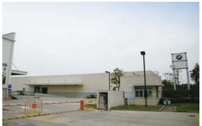
↑ 2016年拍摄 ↓ 2016年拍摄

该项目位于上海临港普洛斯国际物流园区，由上海临港普洛斯国际物流发展有限公司定制承建，是宝马汽车在华最大的物流配送中心。总面积达75,000平方米，建于2013年。除了支持第三方物流公司和停靠洋山深水港的船运公司，普洛斯临港国际物流园向客户提供现代物流仓储设施。厂房围护结构采用宝钢产TS350GD+AZ高强度镀铝锌彩涂钢板，涂层种类为HDP，颜色为白银灰、美深绿、沙白。