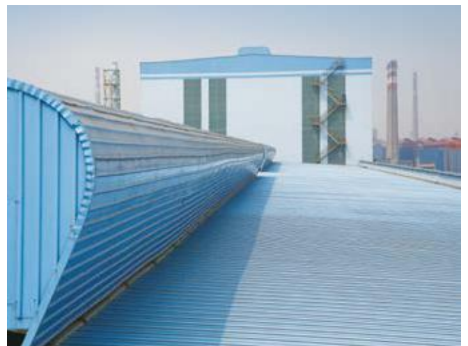
↑ 2016年拍摄 ↓ 2016年拍摄

江苏沙钢集团是江苏省重点企业集团、国家特大型企业、全国最大的民营钢铁企业。沙钢拥有集烧结、焦化、炼铁、炼钢、连铸、连轧及相应配套公辅设施于一体的650万吨钢板生产线一条（其中热卷板450万吨、特宽厚板200万吨），国际先进水平超高功率电炉炼钢、连铸生产线五条等。具有年生产铁1000万吨、钢1500万吨、材1500万吨、不锈钢薄板40万吨、镀锌板15万吨的生产能力。厂房采用宝钢镀铝锌彩涂钢板，外板为0.8mm厚度的苏蓝等，内板为0.6mm的沙蓝，镀层重量120克/平方米，涂料均为HDP。