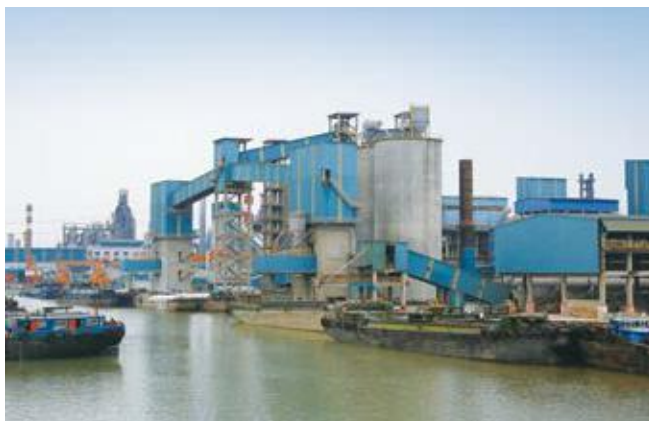
↑ 2016年拍摄 ↓ 2016年拍摄

江苏永钢集团有限公司位于江苏省张家港市，是一家集采矿、炼铁、炼钢和轧钢为一体的大型联合钢铁企业，年炼钢、轧钢能力各500万吨，拥有160亿元总资产。厂房采用宝钢镀铝锌彩涂钢板，外板为0.8mm厚度的瓷蓝，内板为0.6mm的象牙，镀层重量120克/平方米，涂料为PE和HDP。