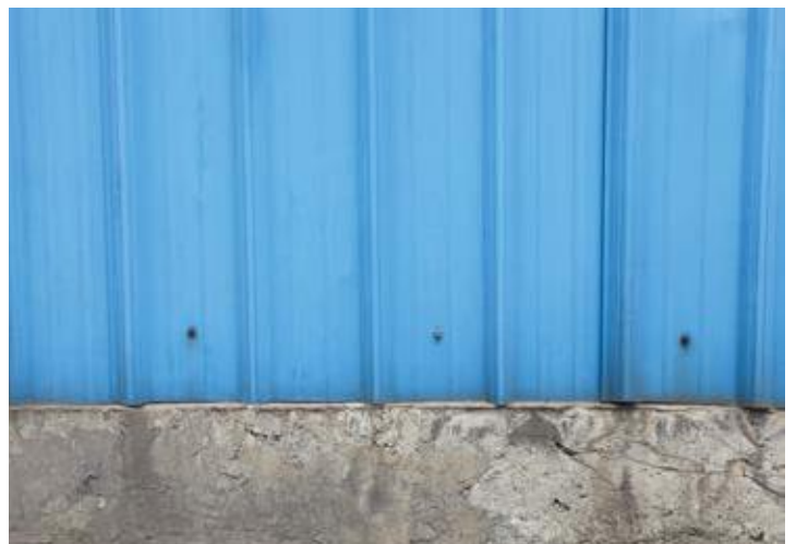
↑ 2011年拍摄 ↓ 2011年拍摄

衡阳钢管厂房位于湖南衡阳市，2006年开始改造扩建，是中国第二专业化无缝钢管生产企业。从2006年建设的炼钢车间、2007年建设的340轧管分厂、2008年建设的管加工2号线、2009年建设的物流仓库到2011年建设的189轧辊车间均使用宝钢热镀锌彩涂。牌号为TDC51D+Z，镀锌量为180克/平方米，颜色为HDP海蓝。