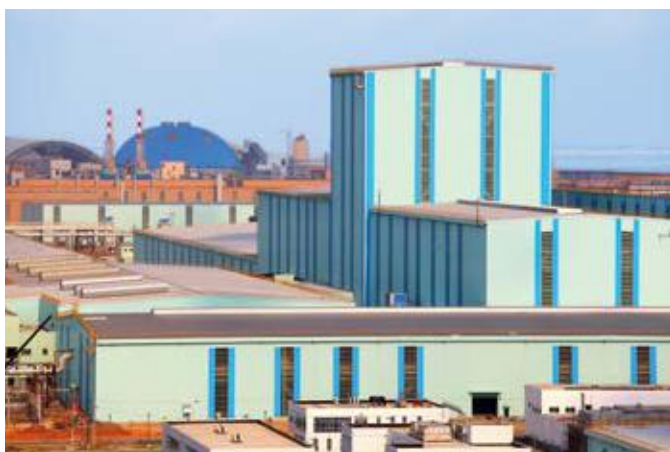
↑ 2016年拍摄 ↓ 2016年拍摄