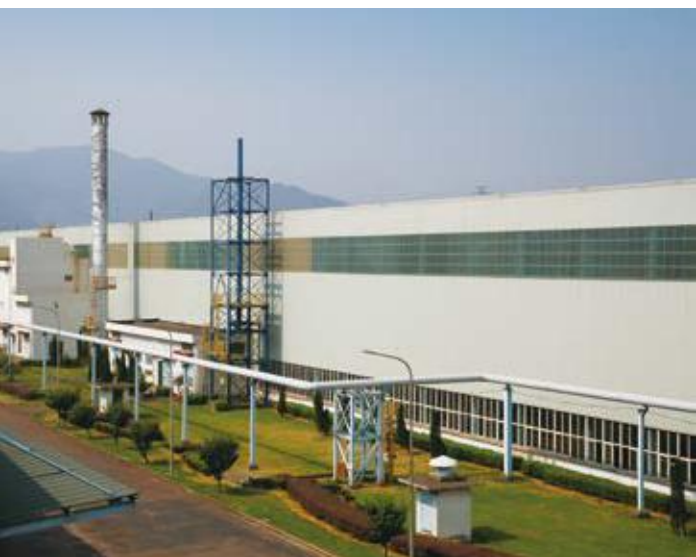
↓ 2016年拍摄 ↘ 2011年拍摄