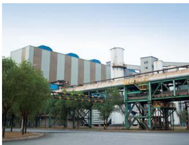
↑ 2016年拍摄 ↓ 2011年拍摄

该项目2007年开始建设，由首钢设计院等单位设计。该工程浩大，建设时间长，在不同的区域（冶炼、轧制）采用不同颜色和品种的彩涂钢板。涂料品种有PVDF和PE，颜色有海蓝、砖红、银灰和中灰，镀锌量有180和275克/平方米两种，牌号为TDC51D+Z/AZ。